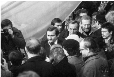
Pogrzeb zamordowanego przez komunistyczną Służbę Bezpieczeństwa ks. Jerzego Popiełuszki, Warszawa, 3 XI 1984 r. Na zdjęciu uczestniczący w pogrzebie działacze ówczesnej opozycji związanej z Solidarnością: Lech Wałęsa, Tadeusz Mazowiecki, Bronisław Geremek