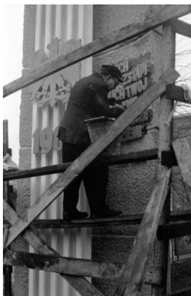
Budowa pomnika - Krzyża Doli Kolejarskiej w Lokomotywowni PKP Lublin, upamiętniającego strajk lubelskich kolejarzy w lipcu 1980 r.