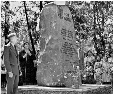
Odsłonięcie pomnika WSK „PZL-Swidnik”, lipiec 1981 r.