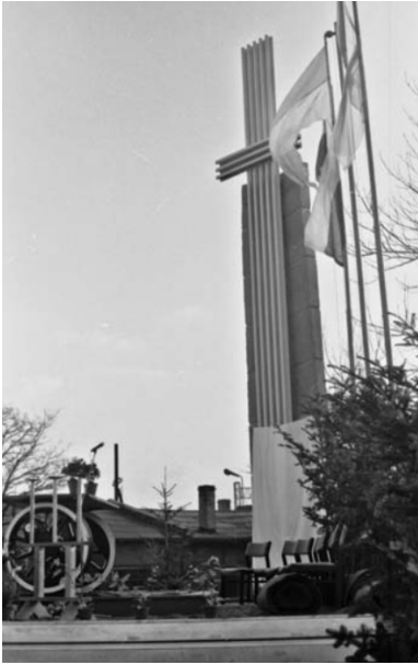
Pomnik - Krzyż Doli Kolejarskiej w Lokomotywni PKP Lublin, odsłonięty 25 listopada 1981 r.