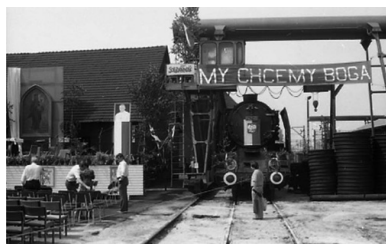
Obchody pierwszej rocznicy lipcowych strajków 1980 r. w Lokomotywowni PKP Lublin

tego, co miesiąc wcześniej wydarzyło się na Lubelszczyźnie.