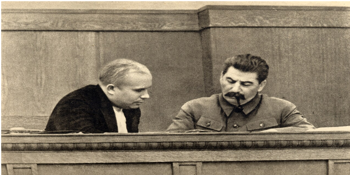
Przed Wielkim Terrorem. Przyszły I sekretarz KP Ukrainy Nikita Chruszczow z Józefem Stalinem w prezydium sesji Centralnego Komitetu Wykonawczego ZSRS, styczeń 1936 r.

https://przystanekhistoria.pl/pa2/tematy/operacja-polska/102678,Operacja-polska-19371938-w-Ukraińskiej-SRS-Antypolski-wymiar-rozkazu-NKWD-nr-004.html