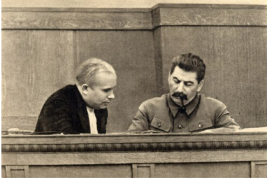
Przed Wielkim Terrorem. Przyszły I sekretarz KP Ukrainy Nikita Chruszczow z Józefem Stalinem w prezydium sesji Centralnego Komitetu Wykonawczego ZSRS, styczeń 1936 r.

Zdarzało się, że niektórych aresztowanych rozstrzelowano przed wydaniem wyroku w sprawie. Skazanych w tej parodii sądowej wyprowadzano z celi, krępowano ręce, obszukiwano, niekiedy rozbierano, a następnie doprowadzano do stolika, gdzie kierujący akcją sprawdzał dane personalne w celu identyfikacji. W przypadku rozbieżności skazanego cofano do celi, w przypadku zgodności prowadzono na rozstrzelanie, które nierzadko odbywało się w grupach wśród stosów ciał. Szarpiących się i wrywających enkawudziści bili niekiedy do nieprzytomności.