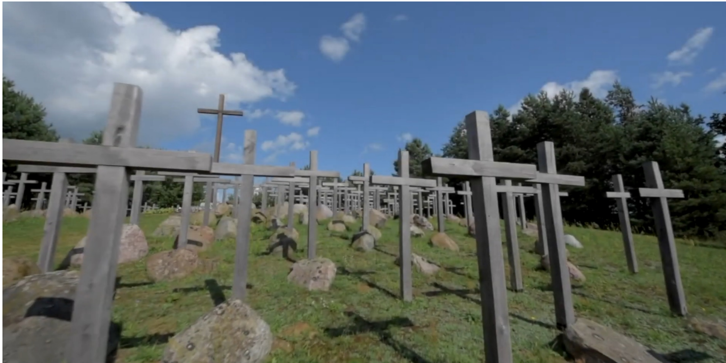
Miejsce upamiętnienia ofiar Obławy Augustowskiej w Gibach

https://przystanekhistoria.pl/pa2/tematy/okupacja-sowiecka/99948,Powojenne-wywozki-zolnierzy-AK-studia-przypadkow.html