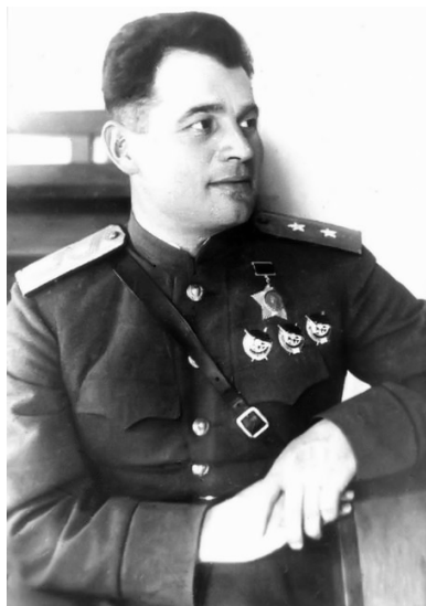
Iwan Czerniachowski, 1943