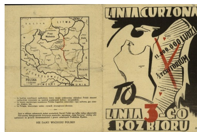
Okładka (ostatnia i pierwsza strona) polskiej ulotki wojennej Linia Curzona to linia 3-go rozbioru