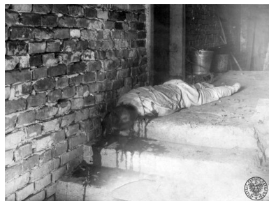
Zwłoki Józefa Hachlicy, prezesa Koła PSL w Krakowie-Prokocimiu, zamordowanego 22 października 1946 r. przed drzwiami własnego domu