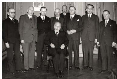
Rząd Tomasza Arciszewskiego, siedzi premier Tomasz

Wizję powojennej demokratycznej Polski sformułowano w deklaracji programowej „O co walczy naród polski”, przyjętej 15 marca 1944 r. przez Radę Jedności Narodowej – podziemny parlament utworzony 9 stycznia 1944 r. Zgodnie z tą deklaracją granice państwa polskiego na zachodzie i północy miały być poszerzone o całe Prusy Wschodnie i Gdańsk, ziemie położone na wschód od Odry i Śląsk Opolski. Na wschodzie zaś miała pozostać granica ustalona w traktacie ryskim w 1921 r. Zapewniano przy tym pełne równouprawnienie polityczne oraz swobodny rozwój kulturalny, gospodarczy i społeczny mniejszości narodowych. Odrodzone państwo polskie miało być w pełni suwerenne i opierać swoją politykę zagraniczną na ścisłym sojuszu z Wielką Brytanią, Stanami Zjednoczonymi, Francją i Turcją oraz na ścisłej współpracy z innymi krajami sprzymierzonymi. Przewidywano także unormowanie stosunków ze Związkiem Sowieckim „pod warunkiem uznania z jego strony integralności przedwojennego terytorium Rzeczypospolitej oraz zasad nieingerowania w sprawy wewnętrzne”.