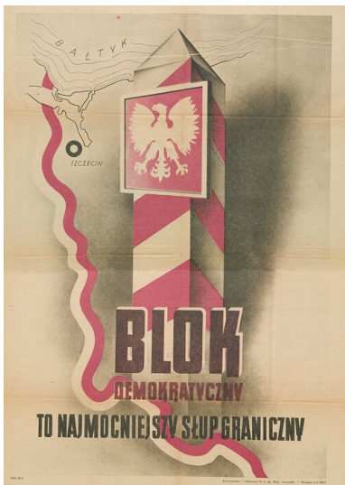
Plakat wyborczy tzw. Bloku Demokratycznego

21 lipca 1944 r. z inicjatywy Józefa Stalina powstał w Moskwie Polski Komitet Wyzwolenia Narodowego, który jako namiastka rządu zainstalował się kilka dni później w Lublinie. 22 lipca PWKN wydał swój „Manifest”, w którym stwierdzono, że „Krajowa Rada Narodowa, powołana przez walczący naród, jest jedynym legalnym źródłem władzy w Polsce”. Według „Manifestu”, KRN, do której weszli „reprezentanci stronnictw demokratycznych”, powołała PKWN jako „legalną tymczasową władzę wykonawczą dla kierowania walką wyzwolenczą narodu, zdobycia niepodległości i odbudowy państwowości polskiej”. Oba te twory, KRN i PKWN, działały rzekomo na podstawie Konstytucji z 17 marca 1921 r., jako „jedynie obowiązującej konstytucji legalnej”. Prawowity Rząd RP w Londynie określono mianem władzy „samozwańczej” i „nielegalnej”, opartej na rzekomo faszystowskiej Konstytucji kwietniowej. Organizację władzy w Polsce zamierzano oprzeć na zaczerpniętym od Sowieców systemie rad narodowych. Deklarowano uroczyście przywrócenie swobód demokratycznych, które nie miały jednak służyć „wrogom demokracji”. W dziedzinie gospodarki manifest zapowiadał odbudowę zniszczeń, zwrot własności zagrabionej przez okupanta i reformę rolną. W sprawie granic ogłoszono przyłączenie Pomorza i Śląska Opolskiego do Polski oraz obiecywano „polskie słupy graniczne na Odrze”, a na wschodzie enigmatyczną „linię przyjaznego sąsiedztwa”.