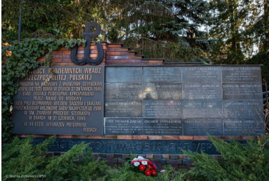
Pruszków, pomnik pamięci 16 przywódców Polskiego Państwa Podziemnego - ofiar sowieckiej zbrodni w 1945 r.

następujące wyroki: gen. Okulicki – 10 lat więzienia, Jankowski – 8 lat, Bień – 5 lat, Jasiukowicz – 5 lat, Pużak – 1,5 roku, Bagiński – 1 rok, Zwierzyński – 8 miesięcy, Czarnowski – 6 miesięcy, Mierzwa, Stypułkowski, Chaciński, Urbański – 4 miesiące. Uniewinnieni zostali: Michałowski, Kobylański i Stemler-Dąbski, zaś Pajdak w osobnym procesie został skazany na 5 lat więzienia 6 .