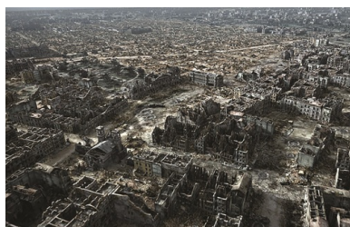
Warszawa w 1945 r. (rekonstrukcja). Kadr z filmu Miasto ruin produkcji Muzeum Powstania Warszawskiego