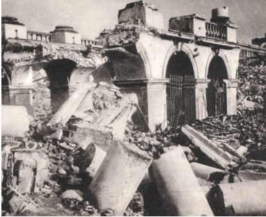
Pałac Saski w Warszawie, wysadzony przez Niemców w grudniu 1944 r.

ponad 60 tys. ludzi. Z kolei między majem a lipcem 1940 r. – 80 tys.; byli to głównie mieszkańcy centralnej i zachodniej Polski uciekający przed Niemcami. Ostatnia fala deportacyjna przypadła na czas między majem a czerwcem 1941 r. i dotknęła blisko 40 tys. osób. Ogółem wywózki objęły ponad 330 tys. obywateli II Rzeczypospolitej, przy czym liczba śmiertelnych ofiar podczas transportów wciąż nie jest znana. Szacunkowo ocenia się, że zginęło ok. 10 proc., głównie najbardziej narażonych, czyli najstarszych oraz dzieci.