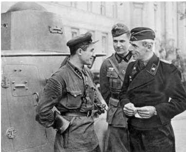
Spotkanie oddziałów niemieckich i sowieckich w Brześciu nad Bugiem, 1939 r.

Najistotniejsze jest jednak to, że ostatecznym rezultatem wojny stała się utrata przez Polskę ponad 45 proc. obszaru sprzed września 1939 r. (ZSRS zaanektował 178 tys. km kw.), co nie zostało w dostateczny sposób zrekompensowane ziemiami na zachodzie. Obecnie powierzchnia państwa polskiego jest mniejsza o niemal jedną piątą od przedwojennej powierzchni II Rzeczypospolitej.