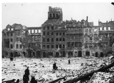
Warszawskie Stare Miasto w 1945 r.

W skrajnie trudnych warunkach wojennych swoistym fenomenem było istnienie Polskiego Państwa Podziemnego dysponującego własną konspiracyjną armią i strukturami administracyjnymi, niezwykle istotnymi zwłaszcza w zakresie oświaty (tajne nauczanie) i wymiaru sprawiedliwości. Poczynania na tych polach nie były iluzoryczne – wymierzano i wykonywano wyroki, przede wszystkim w przypadku zdrajców, kształcono dzieci i młodzież. Przygotowywano się również do odbudowy kraju, już po wojnie, w kształcie skorygowanym ustrojowo, ale bez ubytków terytorialnych. Stąd zjawisko kolaboracji z okupantami było marginalne, a żadna z liczących się podziemnych sił politycznych nie tylko nie brała pod uwagę możliwości zmniejszenia obszaru państwa polskiego, lecz wręcz przewidywano, chociaż w różnych wariantach, jego rozrost kosztem pokonanych Niemiec.