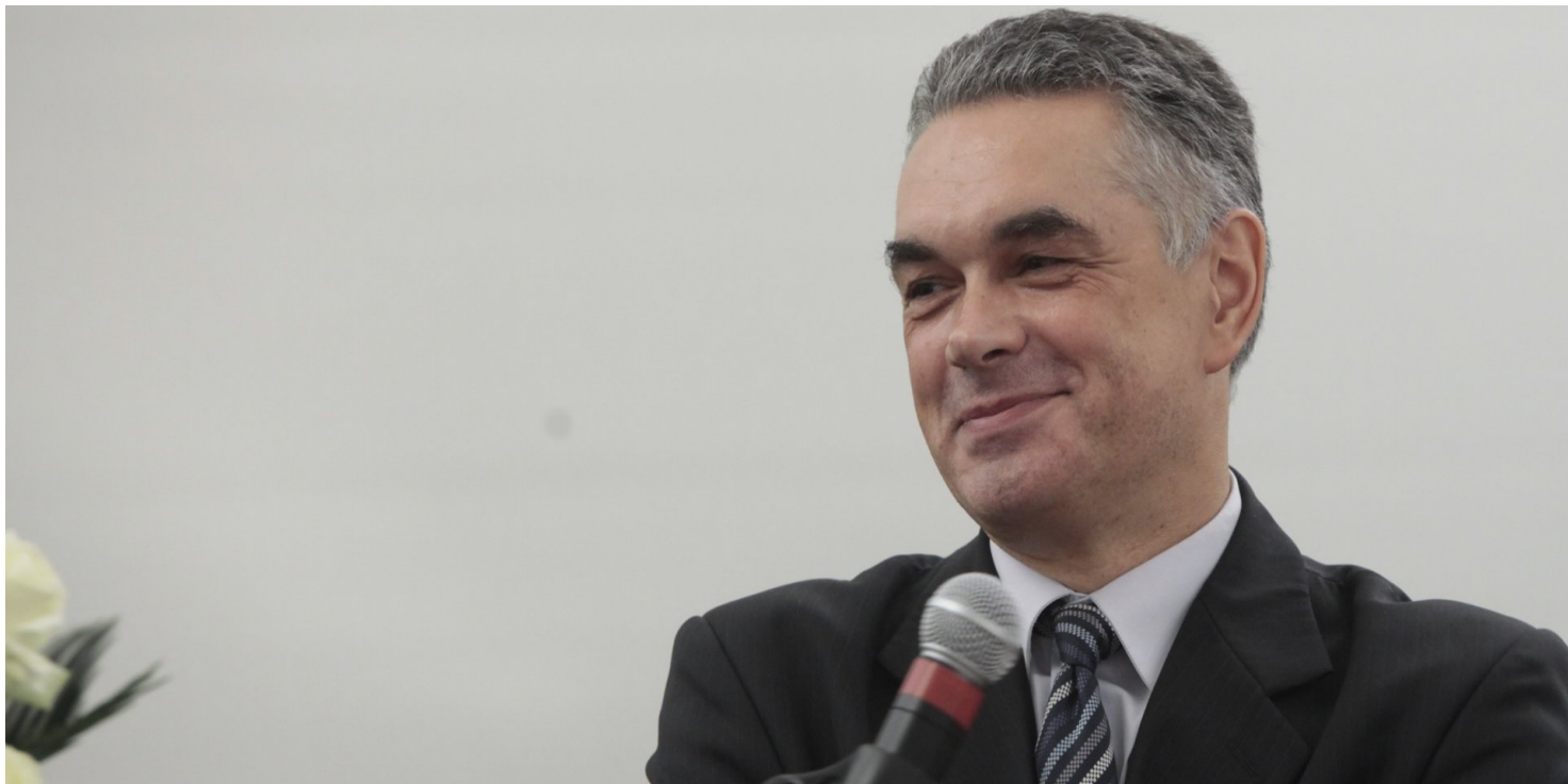
Fot. Piotr Życieński (IPN)

https://przystanekhistoria.pl/pa2/tematy/okupacja-sowiecka/65373,Od-buntu-niewolnikow-po-przystanek-Niepodleglosc-Janusz-Kurtyka-19602010.html