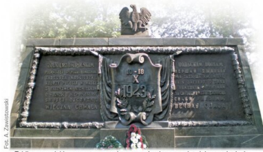
Tablica na polskim cmentarzu wojennym w Lenino upamiętniająca poległych żołnierzy 1 DP