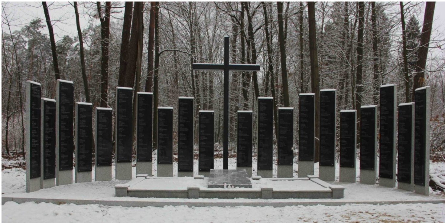
Pomnik-mogiła w Lesie Łuźmierskim

https://przystanekhistoria.pl/pa2/tematy/okupacja-niemiecka/98964,Harcerka-z-Legionu-Wyzwolenia-Helena-Janaszczyk-19101940.html