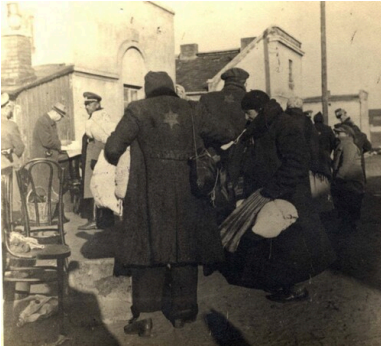
Żydzi we Włocławku noszący żółte odznaki na plecach

wówczas w mieście było ich 285. W powiecie starogardzkim mieszkało 143 Żydów, z których wyjechało od 30 do 60 proc. Według Jana Szilinga z Pomorza Gdańskiego, które weszło w skład Okręgu Rzeszy Gdańsk-Prusy Zachodnie, ewakuowało się nawet ponad 50 proc. Żydów.