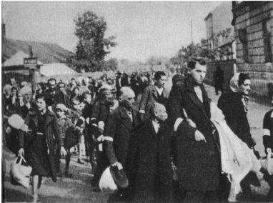
Deportacja Żydów rzeszowskich do obozu w Bełżcu, 1942 r.