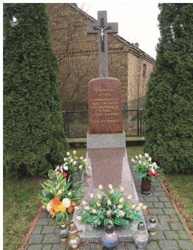
Pomnik wzniesiony na zbiorowym grobie ofiar pacyfikacji Wnor-Wand.

Przyczyną pacyfikacji Wnor-Wand były zapewne dwa wydarzenia. Jakiś czas przed 21 lipca w lesie koło wsi żołnierze podziemia zatrzymali pięcioosobową grupę niemieckich cywilów (zapewne urzędników), których po przeszukaniu puścili wolno. Ponadto w Kuleszach Kościelnych (być może 20 lipca) grupa egzekucyjna wykonała wyrok na miejscowym komisarzu rolnym, który wcześniej publicznie określał mieszkańców Wnor-Wand mianem bandytów. Pewne jest, że gospodarze tej wsi spodziewali się odwetu (być może zostali też ostrzeżeni) i podjęli kroki mające zabezpieczyć ich najbliższych – niektórzy odesłali kobiety i dzieci do rodzin w innych miejscowościach, niemal wszyscy zaś spali poza domem: na wozach czy stogach siana, niejako na czatach, mając nadzieję, że pozwoli im to w porę ostrzec tych, którzy pozostali w domach.