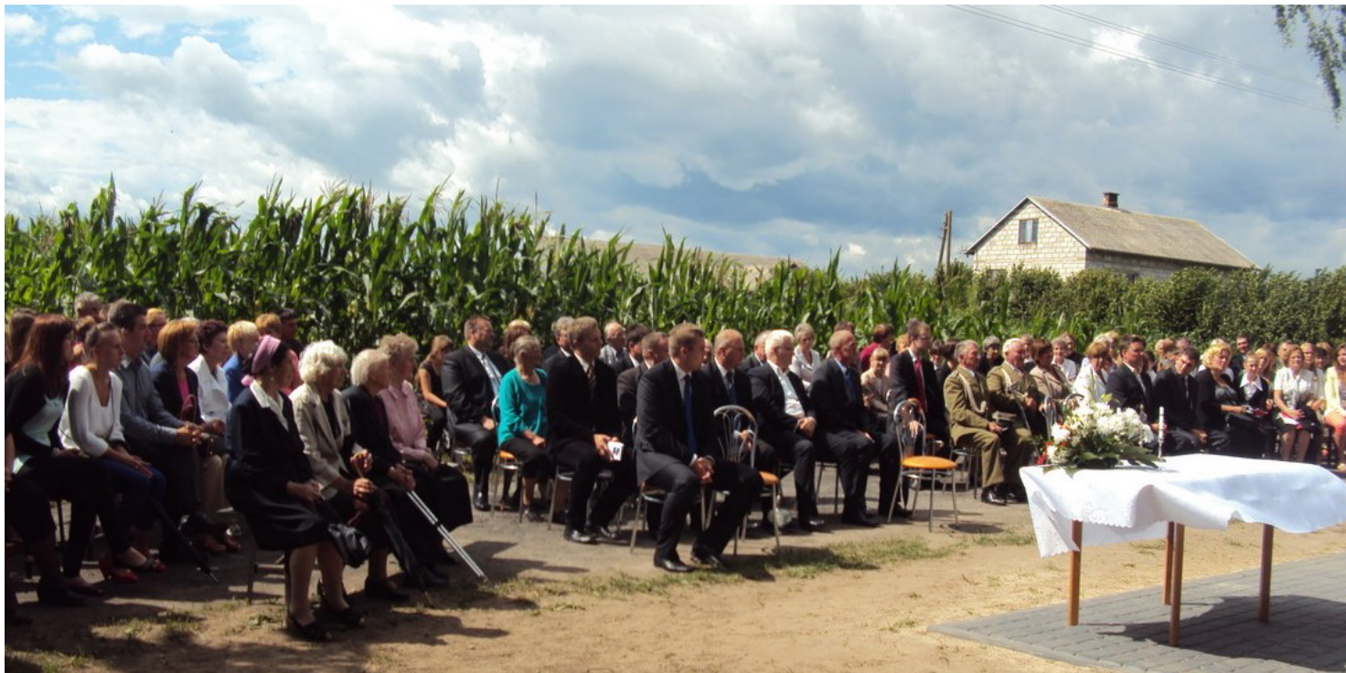
Obchody 70. rocznicy pacyfikacji wsi Wnory Wandy, 2013 r.

https://przystanekhistoria.pl/pa2/tematy/okupacja-niemiecka/93292,Pacyfikacja-Sikor-Tomkowiak-i-Wnor-Wand-w-1943-roku-oraz-upamietnienie-ofiar.html