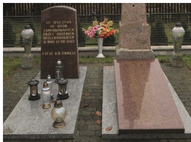
Pomnik wzniesiony na zbiorowym grobie ofiar pacyfikacji Sikor-Tomkowień.

Oddział („grupa Müllera” i oficerowie gestapo) liczący dwustu, trzystu funkcjonariuszy przybył kolumną samochodową do Rutek. Około północy z 12 na 13 lipca, po dołączeniu doń miejscowych żandarmów, został on podzielony na trzy grupy, które wyruszyły w stronę Zawad, Sikor-Tomkowień i Laskowca Starego.