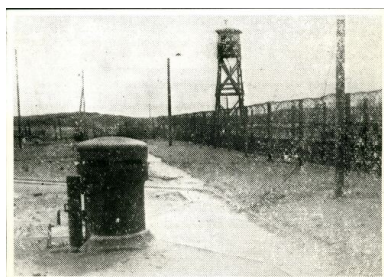
Obóz w Żabikowie.

Szacuje się, że z Żabikowa odeszło do obozów koncentracyjnych 28 transportów z więźniami. Przez tutejszy lagier przewinęło się w sumie ponad 21 tysięcy osób. Wielu więźniów przebywało w Żabikowie kilka miesięcy, a tylko nieliczni zostali stąd zwolnieni. W obozie więźniowie byli przesłuchiwani przez gestapo. Wykonywano tutaj również wyroki śmierci. Na porządku dziennym były tortury i znęcanie się nad osadzonymi.