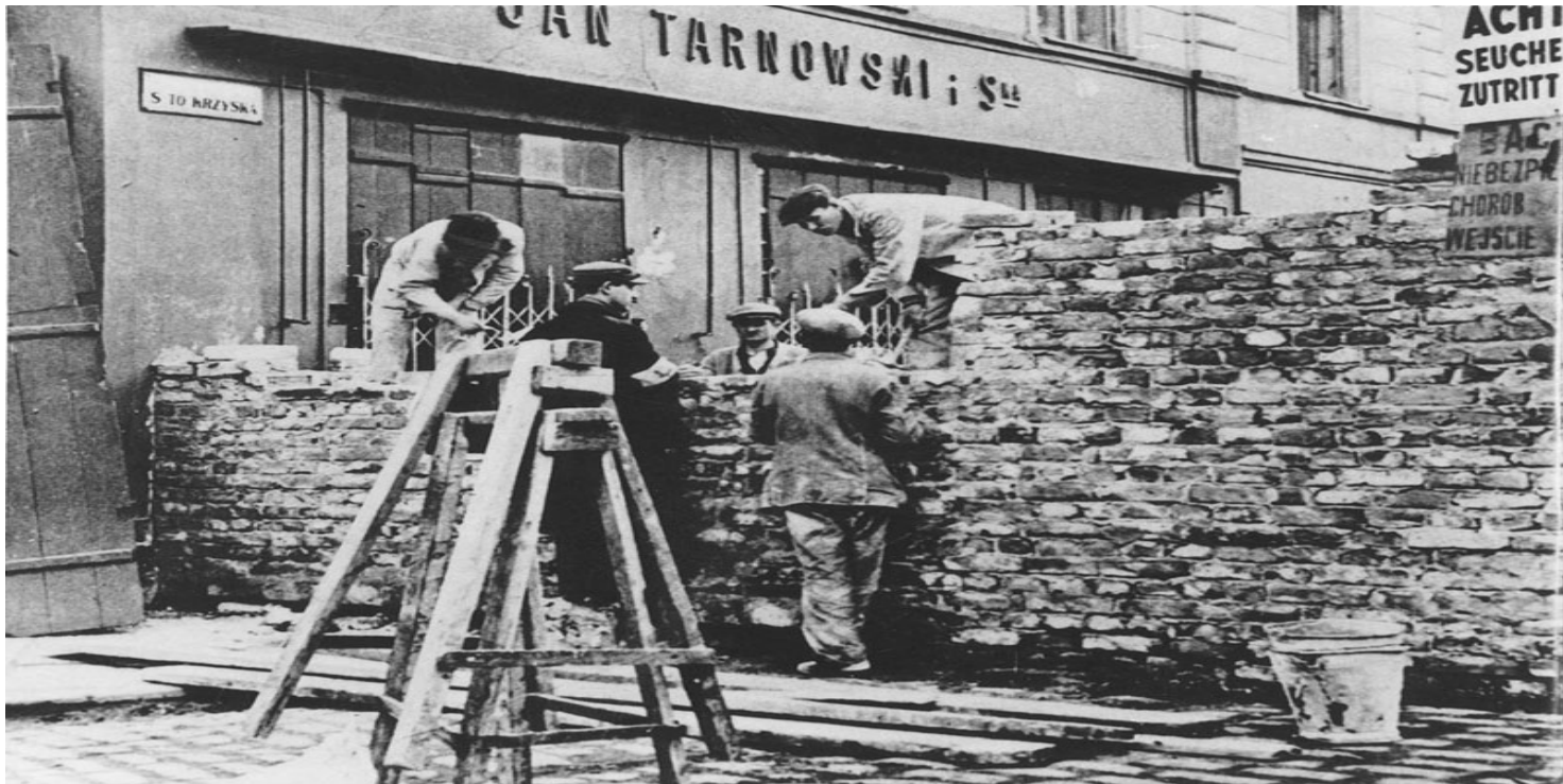
Budowa murów wokół dzielnicy żydowskiej w Warszawie, rok 1940

https://przystanekhistoria.pl/pa2/tematy/okupacja-niemiecka/86923,Smierc-za-dobro-Rozporzadzenie-Hansa-Franka-z-15-pazdziernika-1941-r-a-kwestia-r.html