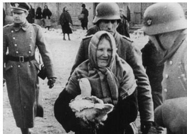
Przeszukanie na targowisku