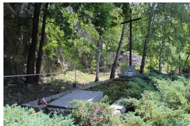
Zbiorowa mogiła polskich więźniów obozu „Liban”

Po zakończeniu II wojny światowej obóz „Liban” i popełnione tutaj czyny stały się przedmiotem śledztwa Głównej Komisji Badania Zbrodni Niemieckich w Polsce. Ustalono, że mord został przygotowany przez komendanta obozu, który chciał uniknąć odpowiedzialności służbowej za dopuszczenie do ucieczki ukraińskich strażników i więźniów obozu. Obecnie w kamieniołomie „Liban” znajduje się zbiorowa mogiła, wykuty w skale