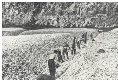
Łamanie i obróbka kamienia

Służba Budowlana nie była formacją nastawioną na fizyczne wyniszczenie młodzieży, jednakże pewne jej działania miały taki skutek. Ciężka praca ponad siły, niskie racje żywnościowe i złe warunki bytowe skutkowały uchylaniem się od służby i uciezkami. Dlatego wobec opornych junaków stosowano brutalne represje.