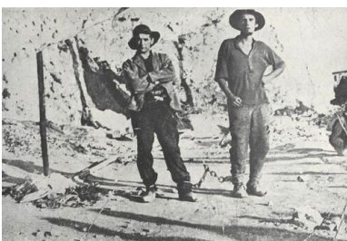
Więźniowie przykuci do siebie łańcuchami

Dopiero od połowy 1943 r. warunki w obozie uległy pewnej poprawie. Założono instalację do mycia. Więźniów zaczęto zaopatrywać w ubrania. Informacje o ich liczbie są bardzo rozbieżne. Ogólną liczbę więźniów, którzy przeszli przez obóz szacuje się na około dwóch tysięcy. Należy dodać, że trafiali tutaj nie tylko junacy z Baudienstu.