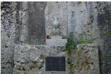
Pomnik z 1948 r. z tablicą pamiątkową