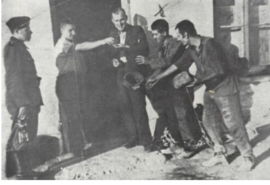
Więźniowie zbierający o chleb

Tam była bardzo ciężka praca i znęcano się nad nami”.