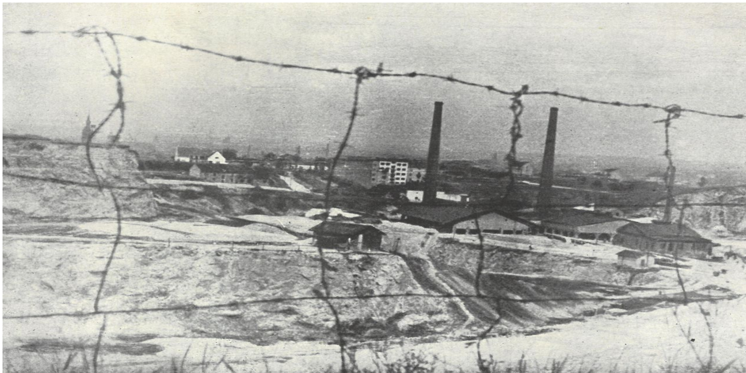
Obóz „Liban” widziany przez druty kolczaste

https://przystanekhistoria.pl/pa2/tematy/okupacja-niemiecka/85195,Masakra-wiezniow-karnego-obozu-pracy-Liban.html