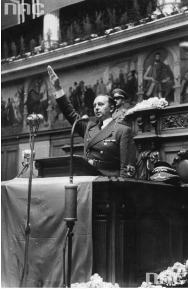
Harodove Arthivum Cyfrowe, sygn. 2-2701