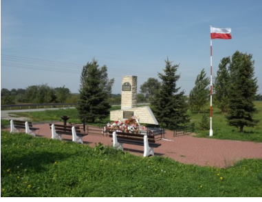
Pomnik upamiętniający poległych pod Słupią partyzantów