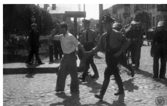
Mężczyzna aresztowany w czasie przesiedlania Żydów do getta w Kutnie w eskorcie dwóch esesmanów na Adolf-Hitler-Platz (obecnie pl. Marszałka Józefa Piłsudskiego) w Kutnie, 16 czerwca 1940 r.

Jakże smutny widok przedstawiała «Konstancja» pierwszego wieczoru. Najsilniejsi płakali, 95% było bez dachu nad głową. Głodne po tym tragicznym dniu dzieci usypiały na leżących tłumokach pościeli pod gołym niebem, przy nich w różnych pozach – jedne klęczały, drugie leżały – matki szeptały słowa modlitwy czy bólu lub patrzyły bezradnie na mężczyzn. Mężczyźni jakże różnie reagowali na tę niemą czy wypowiedzianą rozpacz. Słyszało się przekleństwa czy słowa «kiedy przyjdzie dzień zapłaty », jedni zaciskali pięści, drudzy zachowywali się jak kobiety. W oczach niektórych widać było jakieś silne postanowienie, zaciśnięte usta potwierdzały to prawdopodobnie. Zdawało się, że ich spojrzenia mówią: cierpimy, ale trzeba jakoś zaradzić, musimy w tych tragicznych warunkach umieć żyć. Pragnienie przeżycia miało taką siłę, że wynik różnych rozmyślań dał się widzieć nazajutrz..., w «Konstancji» zawrzało jak w ulu. Energiczniejsi zrozumieli, że skoro muszą tu żyć, muszą sobie to życie ułatwić. Jedni chwyтали się za robienie pałatek, inni wyrzucali żelastwo z fabryki, chcąc ustawić łóżko, bo łóżko było w getcie najniezbędniejszym meblem: na łóżku się spało, jadło, siedziało, ubierało, pod łóżkiem umieszczano statki kuchenne, rzeczy, żywność i inne konieczne rzeczy. Inni zbierali cegłę, by z cegły i gliny skombinować mieszkanie. Zachęcano tych, którzy nie mieli własnej inicjatywy.”