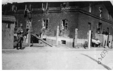
Zabudowania kutnowskiego getta przy ul. Mickiewicza, 1940-1942.

Przed wojną w Kutnie mieszkało około 8 tys. Żydów. Już we wrześniu 1939 r. Niemcy zaczęli ich dyskryminować i wykorzystywać do różnych przymusowych prac fizycznych: rozładunku towarów, sprzątnięcia, prac budowlanych.