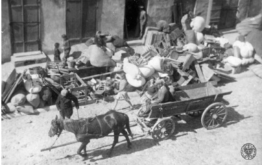
Wysiedlanie kutnowskich Żydów do getta, 16 czerwca 1940 r.

Poprzedniego dnia polskim mieszkańcom tego miasta nakazano pozostanie przez cały dzień w domach, z wyjątkiem właścicieli wozów i koni, którzy na godzinę piątą rano mieli dostarczyć podwody. Środków transportu było jednak za mało i wiele rodzin miało trudności z przewiezieniem swego dobytku. Nadzorujący przesiedlenie niemieccy policjanci wyszydzali i bili Żydów.