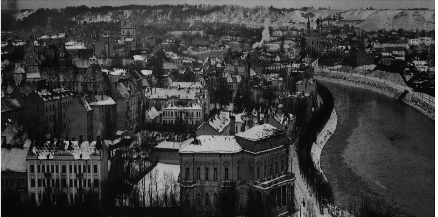
Panorama Wilna.

https://przystanekhistoria.pl/pa2/tematy/okupacja-niemiecka/69450,Obowiazek-wobec-Polski.html