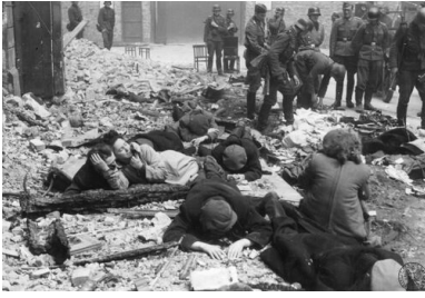
Grupa Żydów schwytyanych przez Niemców w czasie powstania w getcie warszawskim. Fotografia pochodzi z raportu Stroopa.