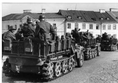
Wojska Wehrmachtu na przedmieściach Częstochowy, wrzesień 1939 r.

Oddziały niemieckie wkroczyły do leżącej nieopodal ówczesnej granicy polsko-niemieckiej Częstochowy o świcie 3 września, kilkanaście godzin po tym, jak miasto, w ramach manewru operacyjnego, opuściła polska 7 Dywizja Piechoty. Na miejscu sformowała się w międzyczasie nieuzbrojona cywilna Straż Obywatelska, która też natychmiast podporządkowała się władzom niemieckim. Tymczasowym komendantem miasta został podpułkownik Oskar Döpping, dowódca 97 Pułku Piechoty.