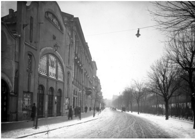
Budynek kina "Wanda" przy ulicy św. Gertrudy w Krakowie, 1933 r.

publiczność, tym bardziej, że w przypadku kin w Krakowie nie przestrzegano ściśle zasad segregacji rasowej.