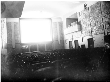
Sala projekcyjna kina "Wanda" przy ulicy św. Gertrudy w Krakowie, 1933 r.

Kino było atrakcyjną i łatwo dostępną formą rozrywki. Bilet był tani – kosztował od 50 groszy do 2-2,5 złotego. Choć najlepsze sale kinowe przeznaczone były dla publiczności niemieckiej, te dostępne dla Polaków również utrzymywano w dobrym stanie – przeprowadzano w nich remonty oraz dbano o wygląd wnętrza – np. w okresie Bożego Narodzenia ustawiano w nich choinki. Do końca 1941 r. wydawano programy do filmów. Grano przeważnie trzy seanse dziennie.