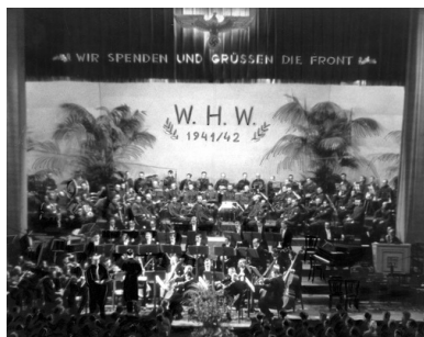
Koncert w kinie "Urania", 1942 r.

Jedna z osób wspominała: „u koników cena biletów dochodziła nawet do 50 złotych”. Proceder ten był na tyle mocno rozwinięty, że oficjalna prasa pisała wręcz o pladze nieuczciwych „pośredników” w sprzedaży biletów.