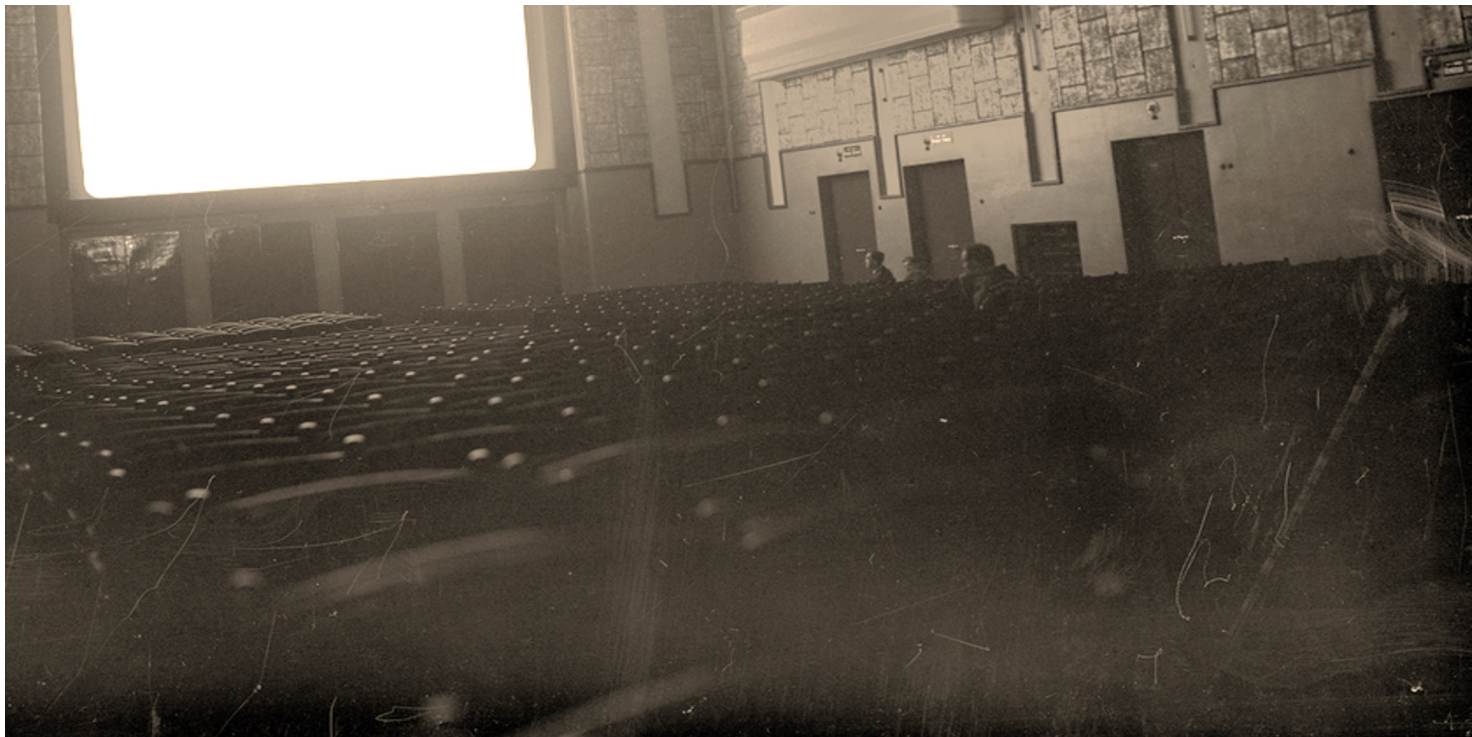
Sala projekcyjna kina "Wanda" przy ulicy św. Gertrudy w Krakowie, 1933 r.

https://przystanekhistoria.pl/pa2/tematy/okupacja-niemiecka/126158,Czy-tylko-swinie-w-krakowskim-kinie.html