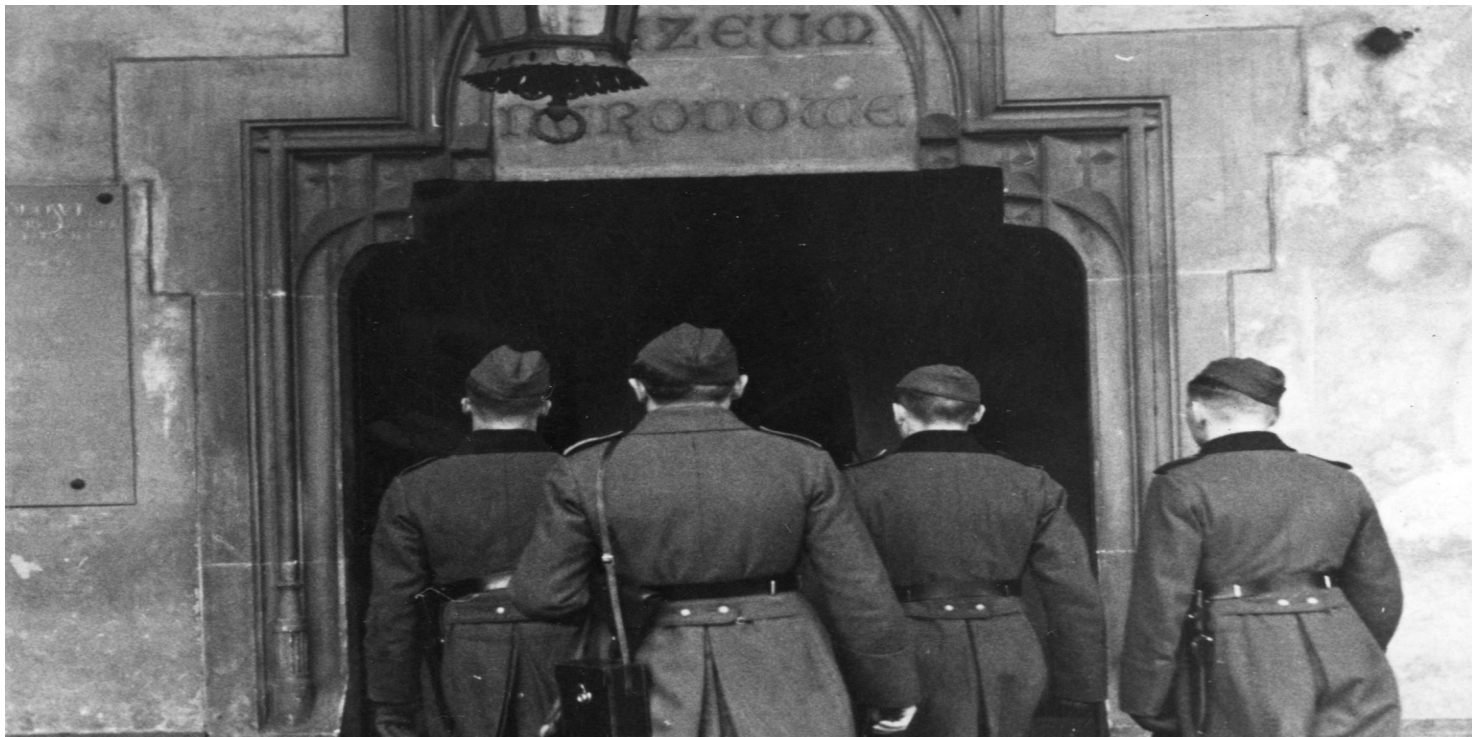
Żołnierze niemieccy wchodzą do gmachu Muzeum Narodowego w Krakowie, 1941 r.

https://przystanekhistoria.pl/pa2/tematy/okupacja-niemiecka/125371,Kajetan-Mhlmann-profesjonalista-i-organizator-rabunku-dobr-kultury.html