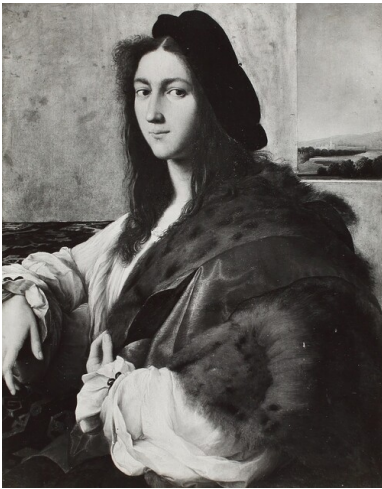
Portret Młodzieńca