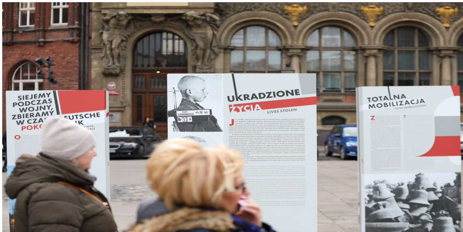
Wystawa IPN „Gospodarka III Rzeszy” w Gdańsku – 17 marca 2023.

https://przystanekhistoria.pl/pa2/tematy/okupacja-niemiecka/106765,Rasowo-wartosciowe-Germanizacja-dzieci-polskich.html