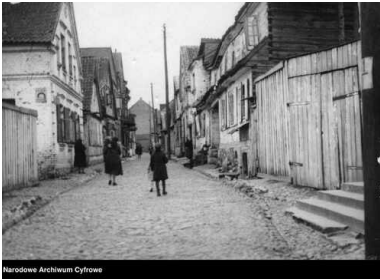
Ulica w żydowskiej dzielnicy Chanajki ( zniszczonej w czasie II wojny światowej), Białystok 1932 r.

Samuel Pisar po latach, podczas swego pobytu w Białymstoku poszukiwał miejsca, gdzie dokonano egzekucji ojca. Ktoś wskazał mu wówczas jakiś krzyż. Polityk nie wiedział jednak kiedy i w jakich okolicznościach rodzic zginął, ani kto się do tego przyczynił. Pora wyjaśnić tę zagadkę.