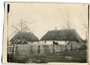
Markowa w obiektywie Józefa Ulmy