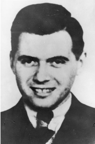
Josef Mengele - lekarz obozowy w KL Auschwitz-Birkenau. Fotokopia

Blok zamieszkiwało około tysiąca kobiet. Lekarki dostawały dla nich tylko kilkadziesiąt aspiryn i parę tabletek przeciwbólowych. Kobiety wydzierały sobie lekarstwa.