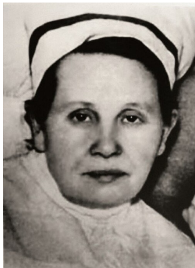
Stanisława Leszczyńska.

właściwe lekarstwo, natychmiast wysyłał wyleczone dzieci do komory gazowej.