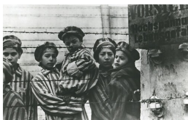
Dzieci - więźniowie obozu oświęcimskiego po wyzwoleniu, luty 1945 r.

Kolejny problem stanowili umysłowo chorzy, a wśród nich niebezpieczni dla otoczenia furiaci, których należało pilnować, aby nie doszło np. do zaproszenia przez nich ognia i pożaru.