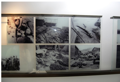
Fragment wystawy stałej w Memorial Gusen. Na wystawie widoczne są zdjęcia z wyzwolenia obozu. Zostały zrobione przez żołnierzy amerykańskich.

Przetrzymani w nim więźniowie drążyli w masywie górskim niedaleko miejscowości St. Georgen kolejne sztolnie, budując pod ziemią jedną z największych fabryk zbrojeniowych III Rzeszy oznaczoną kryptonimem „Bergkristall”. Niemcy wykorzystując niewolniczą pracę więźniów Gusen II, produkowali w niej kadłuby i części do najnowocześniejszego samolotu armii niemieckiej – odrzutowego Messerschmitta 262 oraz rakiet V-2. Wraz z budową Gusen II wstrzymaniu uległy wszelkie prace nad rozbudową Gusen I. Tym samym obóz, jak i cała infrastruktura okolicznych kamieniołomów, przetrwały w tym stanie do momentu wyzwolenia obozu przez wojska amerykańskie 5 maja 1945 r.