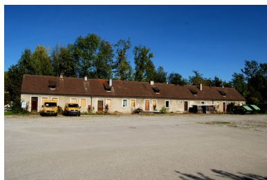
Widok na koszary kompanii wartowniczych znajdujących się dawniej poza murami obozu. Stan na 2018 r.

Praca przy drążeniu sztolni była bardzo niebezpieczna. Podczas jej wykonywania zginęło wielu więźniów. Nie mniej wymagająca od pracy w kamieniołomach była również podziemna produkcja zbrojeniowa w halach „Kellerbau”. Dzięki zmianie profilu funkcjonowania produkcji kamieniarskiej na zbrojeniową, Niemcy i Austriacy nadal maksymalnie wykorzystywali niewolniczą pracę więźniów osadzonych w Gusen. Nie przeszkodziło to w ich dalszej eksterminacji, ponieważ obóz Gusen nadal był uważany za obóz wyniszczenia polskiej inteligencji trzeciej kategorii. To także na ostatni okres funkcjonowania Gusen przypada największa ilość zgonów więźniów.