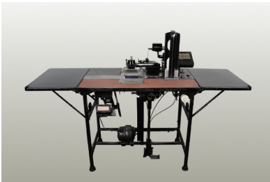
Maszyna adresująca firmy Adrema, lata 20. XX w.

Produkty Adremy bywały również dostosowywane pod względem konstrukcyjnym i funkcjonalnym do potrzeb konkretnej grupy klientów, jak miało to miejsce ze specjalnym zestawem służącym do produkcji i adresowania papierowych tubek, w których w okresie międzywojennym dostarczano gazety do prenumeratorów. Na przełomie drugiej i trzeciej dekady XX w. firma skutecznie propagowała także możliwość zastosowania maszyn adresujących na potrzeby domów towarowych i bibliotek.