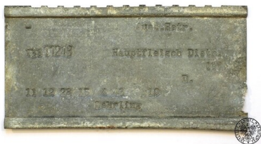
Matryca dotycząca ucznia zatrudnionego przez Berthawerk

Zastosowanie maszyn adresujących, wykorzystujących różnorodne techniki druku, szybko się upowszechniało. Korzystały z nich placówki pocztowe, firmy telegraficzne, banki, ubezpieczyciele i wielkie przedsiębiorstwa przemysłowe. Wzrastający popyt oraz konkurencja przyczyniały się do rozwoju w zakresie produkcji tych urządzeń. Już w latach sześćdziesiątych XIX w. dostępna była na amerykańskim rynku maszyna drukująca adresy zapisane na drewnianych klockach-matrycach. W 1877 r. własny projekt maszyny adresującej złożył w urzędzie patentowym Thomas Edison. U schyłku XIX w. zaczęto wykorzystywać matryce metalowe, łącząc je początkowo w automatycznie przesuwane pasy. W 1907 r. Addressograph Company wprowadziła do sprzedaży adresarkę kartotekową, która drukowała adresy przy użyciu metalowych matryc ułożonych jedna na drugiej za pomocą pionowej prowadnicy. W 1910 r. spółka wzbogaciła ofertę o grafotyp biurowy - elektryczną maszynę do wyłaczania informacji na metalowych płytkach, przeznaczoną dla użytkowników adresarek kartotekowych.