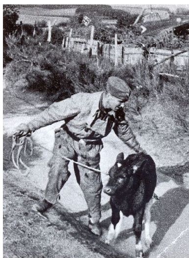
Konfiskata bydła i zwierząt hodowlanych

W obozie nie było żadnej opieki medycznej, a w razie konieczności korzystano z usług lekarza w Łopusznie. Jeszcze w połowie 1942 r. obóz pozbawiony był studni, a wodę do kuchni i mycia przynoszono wiaderkami z odległego o 200 metrów majątku ziemskiego.