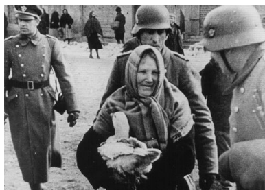
Przeszukanie na targowisku