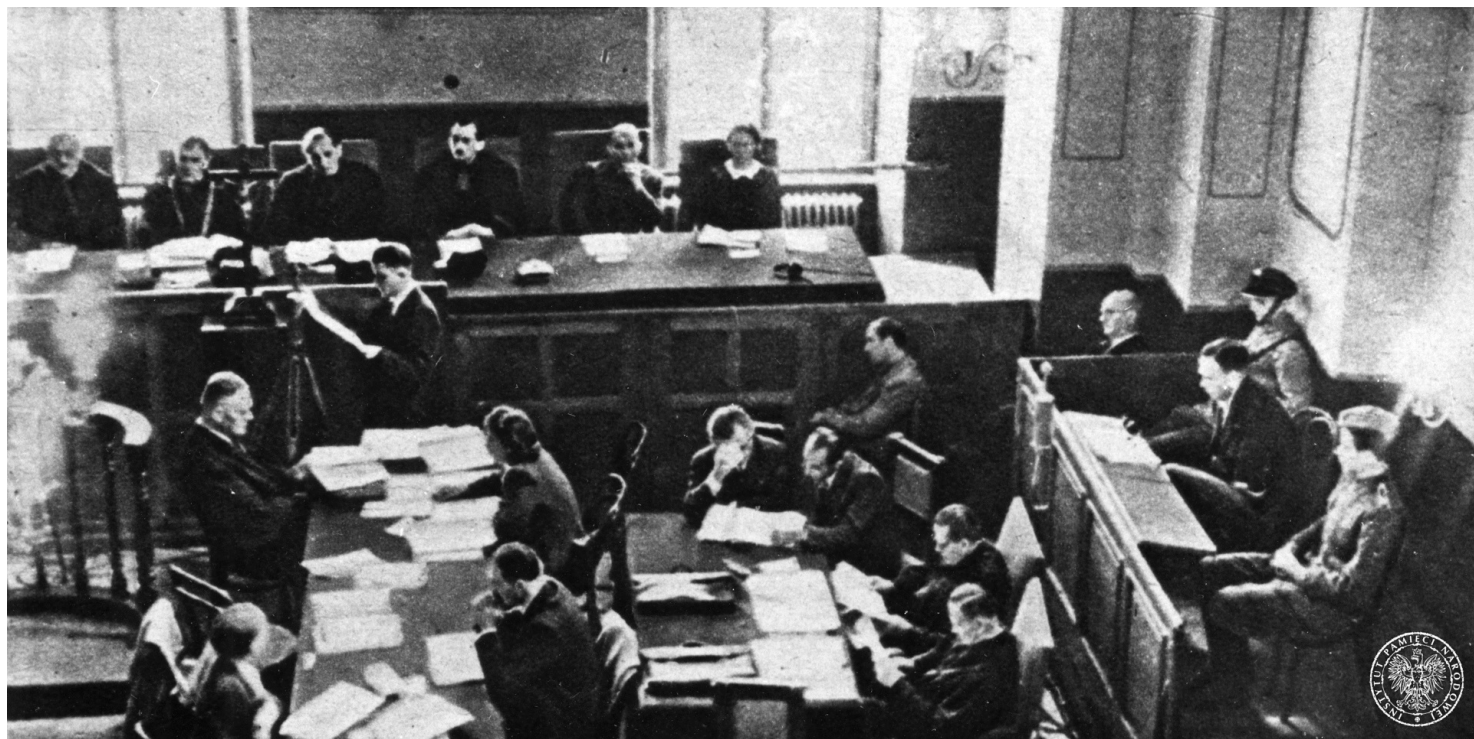
Sala rozpraw w gmachu Sądu Okręgowego w Krakowie w czasie procesu Amona Götha przed Najwyższym Trybunałem Narodowym, 1946 r.

https://przystanekhistoria.pl/pa2/tematy/obozy-koncentracyjne/85948,Morderca-z-Plaszowa.html