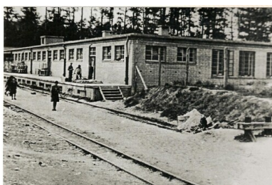
Niemiecki obóz pracy SS w Poniatojew. Hala nr 2, rampa kolejowa i magazyny.

22 października 1943 r. SS-Obergruppenführer Oswald Pohl podjął na piśmie decyzję o przejęciu obozu pracy SS w Poniatojew do Grupy Urzędów D – Obozy Koncentracyjne Głównego Urzędu Gospodarki i Administracji SS ( SS-Wirtschafts- und Verwaltungshauptamt (SS-WVHA) Amtsgruppe D – Konzentrationslager ). Tego samego dnia wydał również rozkaz, aby rozpoczęto prace zmierzające do jego przekwalifikowania na obóz koncentracyjny.