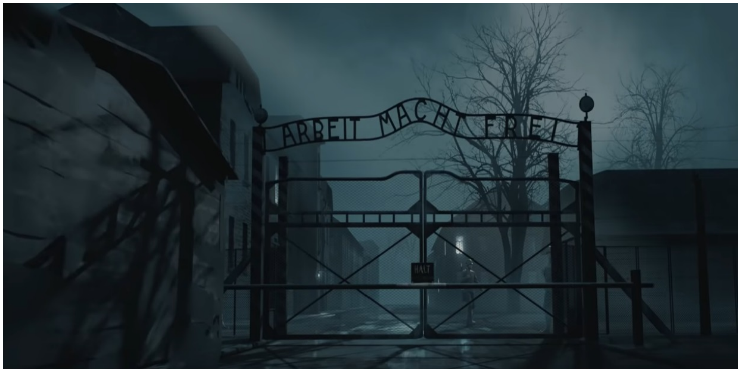
Kadr z filmu IPN Niezwycześni

https://przystanekhistoria.pl/pa2/tematy/obozy-koncentracyjne/76649,Mieszkanicy-Kreishauptmannschaft-Busko-w-KL-Auschwitz-Birkenau.html