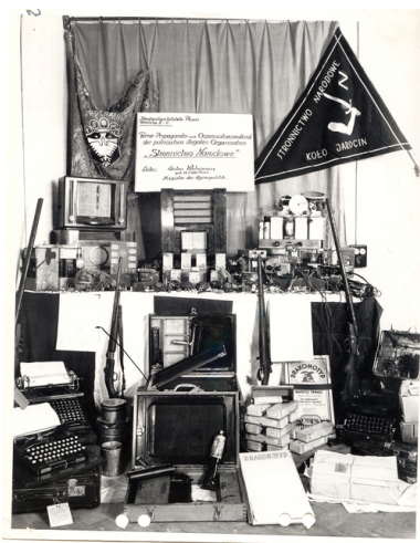
Sprzęt konspiracyjny przejęty przez niemiecką policję