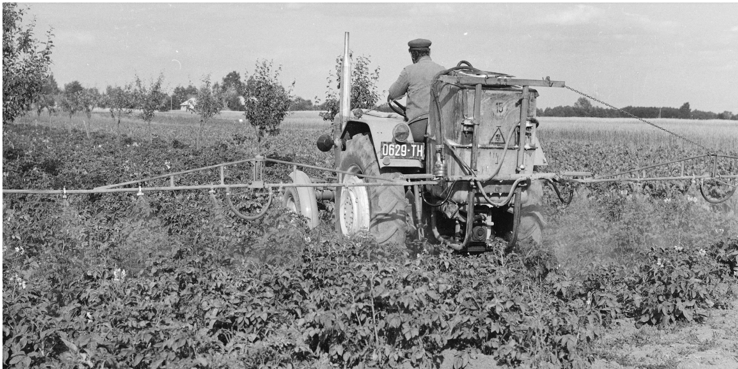
Oprysk ziemniaków przeciwko stonce ciągnikiem Ursus C-330 z opryskiwaczem polowym, 1976 r. Fot. NAC

https://przystanekhistoria.pl/pa2/tematy/nrd/76457,Z-Kolorado-do-Polski-ludowej-Inwazja-stonki-ziemniaczanej.html