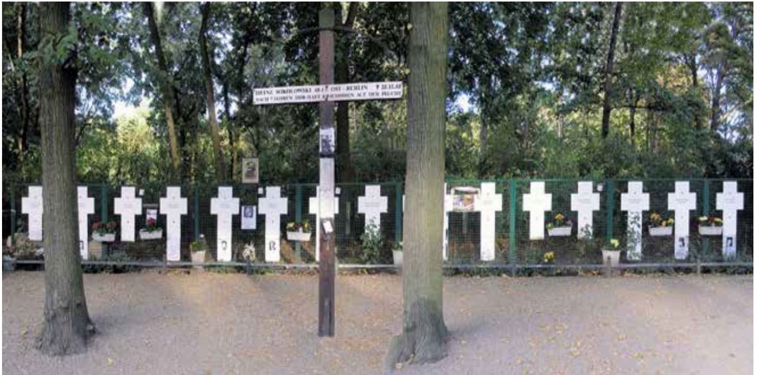
Symboliczne białe krzyże upamiętniające zabitych przy przekraczaniu muru berlińskiego

https://przystanekhistoria.pl/pa2/tematy/nrd/103797,Strzal-w-plecy.html