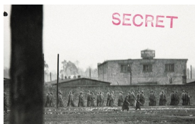
Wymarsz więźniów do pracy w niemieckim obozie w Jaworznie

W obozie świętochłowickim miejscem szczególnych represji był barak nr 7 7 , w którym przebywali m.in. oskarżeni o członkostwo w NSDAP. Więźniowie byli bici (m.in. nogami od stołu), zmuszani do wielogodzinnego biegania, stójk karnych z cegłami na głowie, osadzani w karczerze wypełnionej wodą oraz karani tzw. ukraińskimi procesjami 8 . Niektórzy więźniowie próbowali uciekać, zdarzały się też przypadki samobójstw, gwałtów i morderstw. W obozie w Jaworznie zmarło ponad 6 tys. osób.