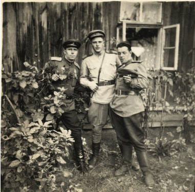
Żołnierze Armii Czerwonej, zdjęcie wykonane prawdopodobnie w 1944 r. na terytorium Polski

„Mają oni nieograniczoną władzę w tym miejscu. Nic więc dziwnego, że prawie żaden transport nie doszedł na miejsce przeznaczenia cały nierzuszony”