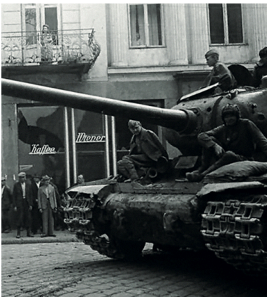
Armia Czerwona w Rzeszowie, sierpień 1944 r.

Z raportu AK wynika, że analogicznie wyglądała sytuacja w powiecie przemyskim.