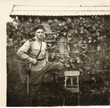
Żołnierze Armii Czerwonej, zdjęcie wykonane prawdopodobnie w 1944 r. na terytorium Polski