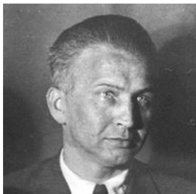
Ostatni komendant AK gen. Leopold Okulicki „Niedźwiadek”

decyzji pozostałych również zgodził się na swój udział.