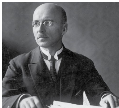
Delegat Rządu na Kraj Jan Stanisław Jankowski