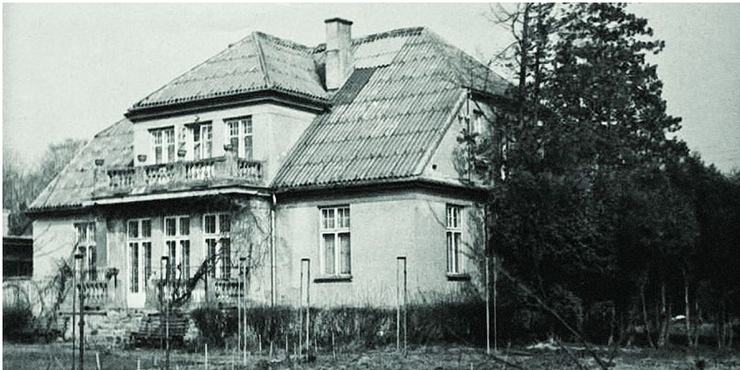
Willa w Pruszkowie

https://przystanekhistoria.pl/pa2/tematy/nkwd/79966,Aresztowanie-szesnastu-przywodcow-Polskiego-Panstwa-Podziemnego.html