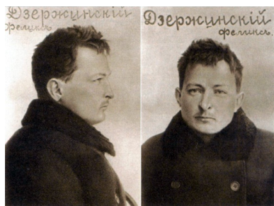
Feliks Dzierżyński, akta Ochrany,

Postanowiłem przyrzeć się porewolucyjnym losom kilkunastu znanych Polaków, którzy brali udział w rewolucji październikowej w Piotrogradzie. Lista nie jest pełna – to wyłącznie ci, o których udało mi się znaleźć informacje.