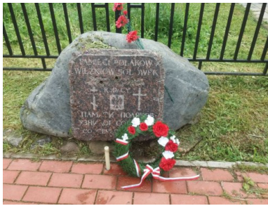
Tablica „Pamięci Polaków więźniów Sołówek - rodacy”

To największe wzniesienie na Wielkiej Sołowieckiej. W tutejszej cerkwi pod wezwaniem Wniebowstąpienia Pańskiego, pełniącej zarazem funkcję latarni morskiej, NKWD urządziło karcer. Zsyłano tu ludzi za ucieczki, nieposłuszeństwo i przestępstwa pospolite. Jedną z metod egzekucji było przywiązywanie więźniów do drewnianej kłody i strącanie ze stromych, liczących 365 stopni schodów – ginęli w niewypowiedzianych męczarniach. Zimą przywiązywano skazańców do pnia drzewa i oblewano wodą, latem wystawiano nagich na żer komarom. U podnóża Siekierniej Góry rozstrzeliwano uwięzionych. W trakcie badań archeologicznych przeprowadzonych w 2006 r. odnaleziono w tym miejscu 126 ludzkich szkieletów. Miejsc kaźni było o wiele więcej, większość nadal nie jest zlokalizowana. Dziś wiadomo o masowych mordach na Wyspach w 1923, 1929 oraz w 1937 r.