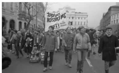
Pochód studencki w Warszawie w celu ponownej rejestracji NZS-u, 1 marca 1989 r.

W ciągu września i października 1980 r. NZS-y powstały na niemal wszystkich wyższych uczelniach w kraju. Statut nowej organizacji studenckiej, wspierany akcjami plakatowo-informacyjnymi w celu rejestracji, został w końcu zatwierdzony przez ministra Nauki, Szkolnictwa Wyższego i Techniki 17 lutego 1981 r.