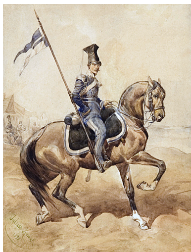
Ułan Gwardii Narodowej we Lwowie z 1848 na ilustracji Juliusza Kossaka

Powstańcy nie byli w stanie sprostać regularnym oddziałom austriackim. Rząd Narodowy nie panował nad sytuacją, zresztą już 24 lutego Tyssowski, choć chwiejny i skłonny do kompromisu, proklamował dyktaturę. W zamierający ruch nowego ducha usiłował tchnąć Dembowski, który tego samego dnia zjawił się w Krakowie.