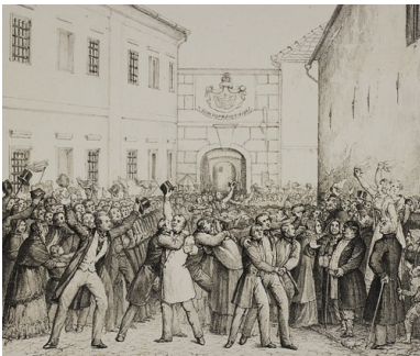
Uwolnienie więźniów politycznych w Krakowie w roku 1848, grafika Jana Kantego Lorenowicza, ze zbiorów Biblioteki Narodowej

Wybuch powstania przerodził się w oderwane od siebie, pojedyncze zbrojne incydenty. Trzy dni przed wyznaczonym terminem, 18 lutego, osłabiony, choć zdeterminowany oddział powstańczy usiłował zająć Tarnów. W powiecie brzeżańskim, pod Narajowem, licząca pół setki osób partia powstańcza, dowodzona przez wieloletniego konspiratora i emisariusza, Teofila Wiśniowskiego, starła się ze szwadronem huzarów. W Królestwie ledwie kilkunastoosobowa grupa, której przewodził Pantaleon Potocki, podjęła próbę opanowania Siedlec. W nieodległym od Krakowa Miechowie sformował się liczący około 200 ludzi oddział, który po rozbiciu posterunków granicznych ruszył na Kraków. Agitujący pośród Kaszubów młody lekarz, Florian Ceynowa, zdołał zebrać bez mała setkę parobków i wyrobników, gotowych uderzyć na pruską załogę w Starogardzie. Wreszcie 3 marca kolumna powstańcza, która od strony Kórnika ruszyła na Poznań, dostała się w zasadzkę przy moście Chwaliszewskim – zamiast oswozić więzionych w Cytadeli przywódców ruchu powiększyła tylko liczbę zatrzymanych przez pruską policję.