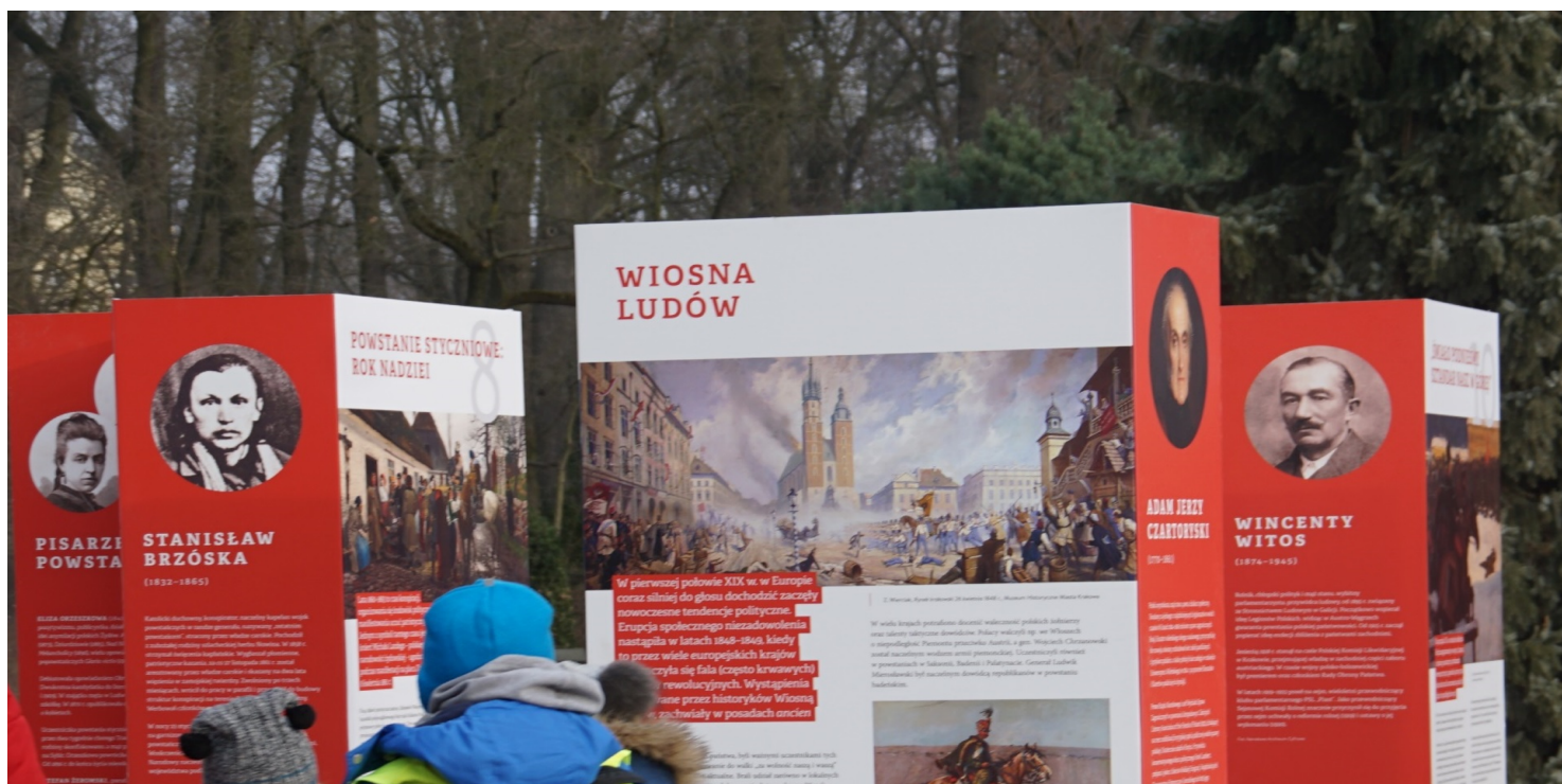
Wystawa IPN „Polski gen wolności. 150 lat walk o niepodległość” – Warszawa, 2019

https://przystanekhistoria.pl/pa2/tematy/niepodleglosc/99651,Polski-czas-Wiosny-Ludow.html