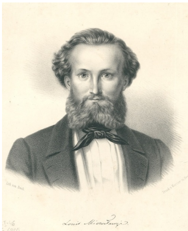
Ludwik Mierosławski na grafice z połowy XIX w.

Plan, nakreślony z iście „napoleońskim” rozmachem, pozostał jednak na papierze. Wskazano wodza, ustalono skład Rządu Narodowego, na połowę lutego 1846 r. wyznaczono termin wybuchu powstania. Powstanie jednak nie wybuchło. Zadecydowały słabość sił własnych i pospolita zdrada.