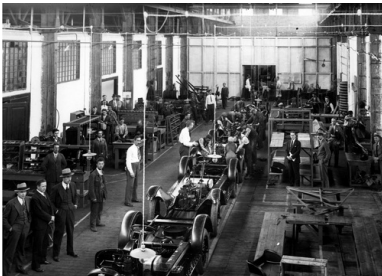
Fabryka samochodów General Motors w Warszawie - widok ogólny hali produkcyjnej, około 1930 r.