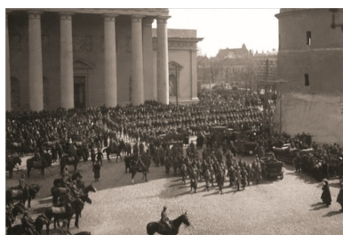
Oddziały Wojska Polskiego przed katedrą św. Stanisława i św. Władysława w Wilnie po uroczystym nabożeństwie, 22 kwietnia 1919 r.

Wierzył, że możliwe jest zrealizowanie idei państwa federacyjnego, wielonarodowego, w którego granicach przywrócono by świetność dawnej Rzeczypospolitej. Jednak już w kilka dni po wyzwoleniu Wilna i rozpoczęciu rozmów z lokalną elitą polityczną, musiał przyznać, że nie znalazł zwolenników szerszego porozumienia, w zamyśle przygotowującego grunt dla przyszłej realizacji koncepcji federacyjnej. Nawet miejscowi Polacy „ogłądali się na Warszawę” i nie akceptowali przyszłości innej niż wcielenie ich ziem do Polski. Uważali, że z powodów historycznych, statusu majątkowego i poziomu rozwoju kulturalnego do nich należy pierwszoplanowa rola przy decydowaniu o sprawach byłego WKL.