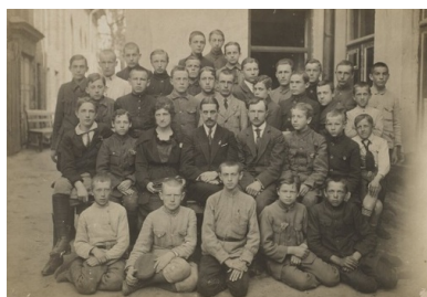
Uczniowie czwartej klasy i nauczyciele Gimnazjum Polskiego im. Adama Mickiewicza w Kownie, 1921 r.

Życie polityczne na ziemiach b. WKL w ostatnich miesiącach 1918 r. uległo gwałtownemu przyspieszeniu. Klęska państw centralnych i widoczne oznaki odradzania się państwa polskiego na terenie Kongresówki skłoniły Polaków z kresów do podjęcia szeregu działań. Już w połowie lipca 1918 r. powstał Związek Wojskowych Polaków miasta Wilna, który usiłował nawiązać kontakt z polskim ośrodkiem władzy w Warszawie. Komitet Polski w Wilnie 17 października 1918 r. wydał odezwę, w której domagał się zjednoczenia z Polską ziemi, na której w większości mieszkają Polacy, a pozostałe terytorium Litwy chciał połączyć z Polską „nie przesądzając formy, w jakiej będzie to dokonane”.