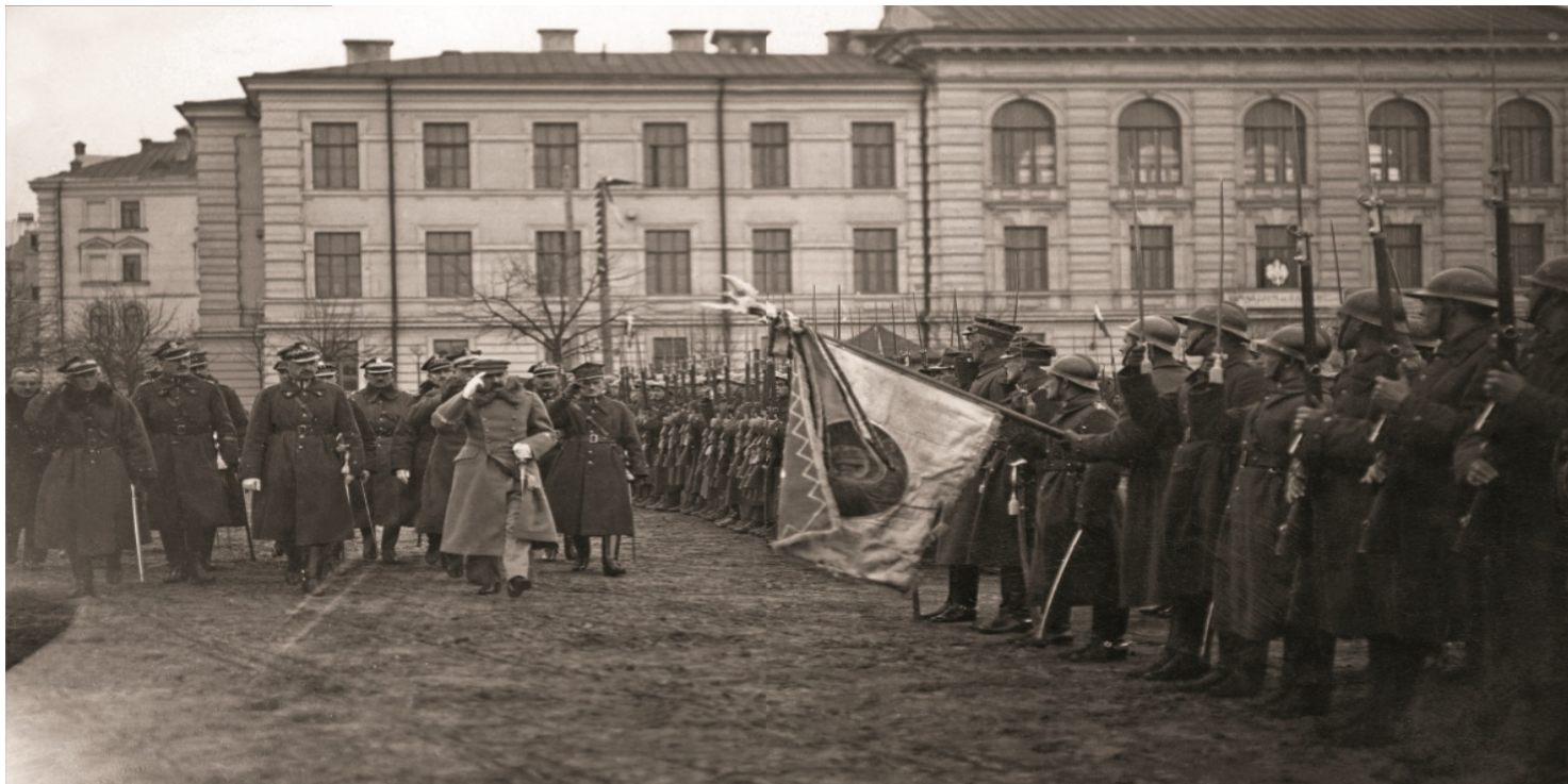
Przegląd wojska dokonany przez Naczelnika Państwa Józefa Piłsudskiego po zajęciu Wilna, kwiecień 1919 r.

https://przystanekhistoria.pl/pa2/tematy/niepodleglosc/89431,Starania-Polakow-z-Wilenszczyzny-o-wlaczzenie-ich-ziem-do-Polski-w-1919-roku.html