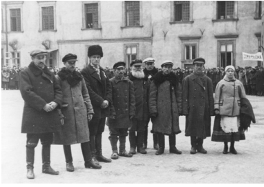
Chłopi z Wileńszczyzny i Polesia na Zamku Królewskim w Warszawie, 15 listopada 1934 r.