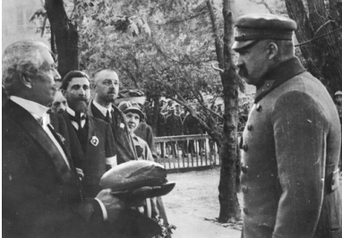
Wizyta Józefa Piłsudskiego w nierozpoznanej miejscowości, 1919 r.

Warto zwrócić uwagę, że wolę przyłączenia się do Polski wyrażali mieszkańcy miejscowości położonych nawet w pobliżu granicy Litwy z Łotwą jak np. Gryzkowszczyzna, Szułany, Jezierzyski, Girwały itd. (pow. jezioroski, d. nowoaleksandrowski). Pisma o podobnej treści spływały do Warszawy przez następne miesiące, aż do ofensywy bolszewickiej latem 1920 r.