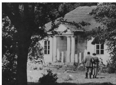
Dwór na Wileńszczyźnie, widok około lat 20. XX w.

W pierwszych miesiącach 1919 r. Polska nie miała wystarczających sił, by walczyć jednocześnie na wielu frontach. 10 stycznia 1919 r., będąc jeszcze pod wrażeniem zajęcia Wilna przez bolszewików, gen. Stanisław Szeptycki, Szef Sztabu Generalnego Wojsk Polskich, w piśmie do Józefa Piłsudskiego, Tymczasowego Naczelnika Państwa i zwierzchnika polskiej armii, zwrócił uwagę, że jednym z głównych celów stojących przed WP było „wstrzymanie fali bolszewickiej”, które to zadanie wobec wzrostu nastrojów rewolucyjnych w Niemczech i nadciągania, po zajęciu Wilna, wojsk sowieckich, urasta do rangi najpilniejszego. Rady te nie zostały wysłuchane – na próbę odzyskania Wilna Piłsudski zdecydował się dopiero w kwietniu 1919 r., gdy nadciągała już z zachodu „błękitna armia” gen. Józefa Hallera i zakończyły się walki o Lwów. Dokonała się również w tym momencie ewakuacja większości wojsk niemieckich, więc polscy żołnierze mieli otwartą drogę na wschód.