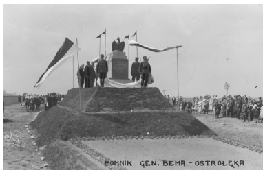
Obchody rocznicy powstańczej bitwy pod Ostrołką, 23 maja 1931 r.

Sukces wojsk powstańczych przypieczętować miał nowy, przygotowany przez Prądyńskiego, manewr. Jego celem miało być zniszczenie oddalonych od głównych sił Dybicza, stacjonujących w okolicach Łomży, oddziałów gwardii cesarskiej. Rosjan dopadnięto pod Śniadowem, ale i tu Skrzynecki zwlekał tak długo, aż nieprzyjaciel wymknął się z pułapki. Co gorsza, na cofające się polskie oddziały spadło 26 maja uderzenie głównych sił Dybicza. Fatalnie dowodzone przez Skrzyneckiego oddziały polskie od zupełnej klęski ocaliła dowodzona przez płk. Józefa Bema artyleria konna, której szarże umożliwiły wyprowadzenie przynajmniej części sił z pogromu. Armia rosyjska dziesiątkowana chorobami (w czerwcu na cholere umarł sam Dybicz) nie była w stanie wyzyskać sukcesu. Z kolei polskie dowództwo przestało panować nad sytuacją. Żołnierz pragnął walczyć – generałowie zaś za wszelką cenę starali się walki unikać.