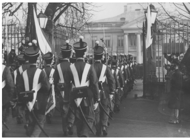
Obchody rocznicy powstania listopadowego w Warszawie. Pluton podchorążych w mundurach historycznych wkracza na dziedziniec Belwederu, 30 listopada 1930 r.

Mikołaj I, nie bez podstaw zwany „żandarmem Europy”, nie zamierzał pozostawać bezczynny. Ze zmianami we Francji gotów był się pogodzić, wszelako wydarzenia belgijskie skłaniały go do zbrojnej interwencji po to, by rewolucyjne idee nie zagroziły i samej Rosji. Świetnie wyszkolona armia polska, na czele z wielkim księciem Konstantym, miała stanowić straż przednią potęgi gotowej przywrócić porządek. Spiskowcy, nic chcąc przykładać ręki do tego dzieła, a ponadto sami zagrożeni aresztowaniami, postanowili wystąpić czynnie. Termin wybuchu powstania wyznaczono na 29 listopada 1830 r. Sygnałem do akcji miał stać się pożar browaru na Solcu.