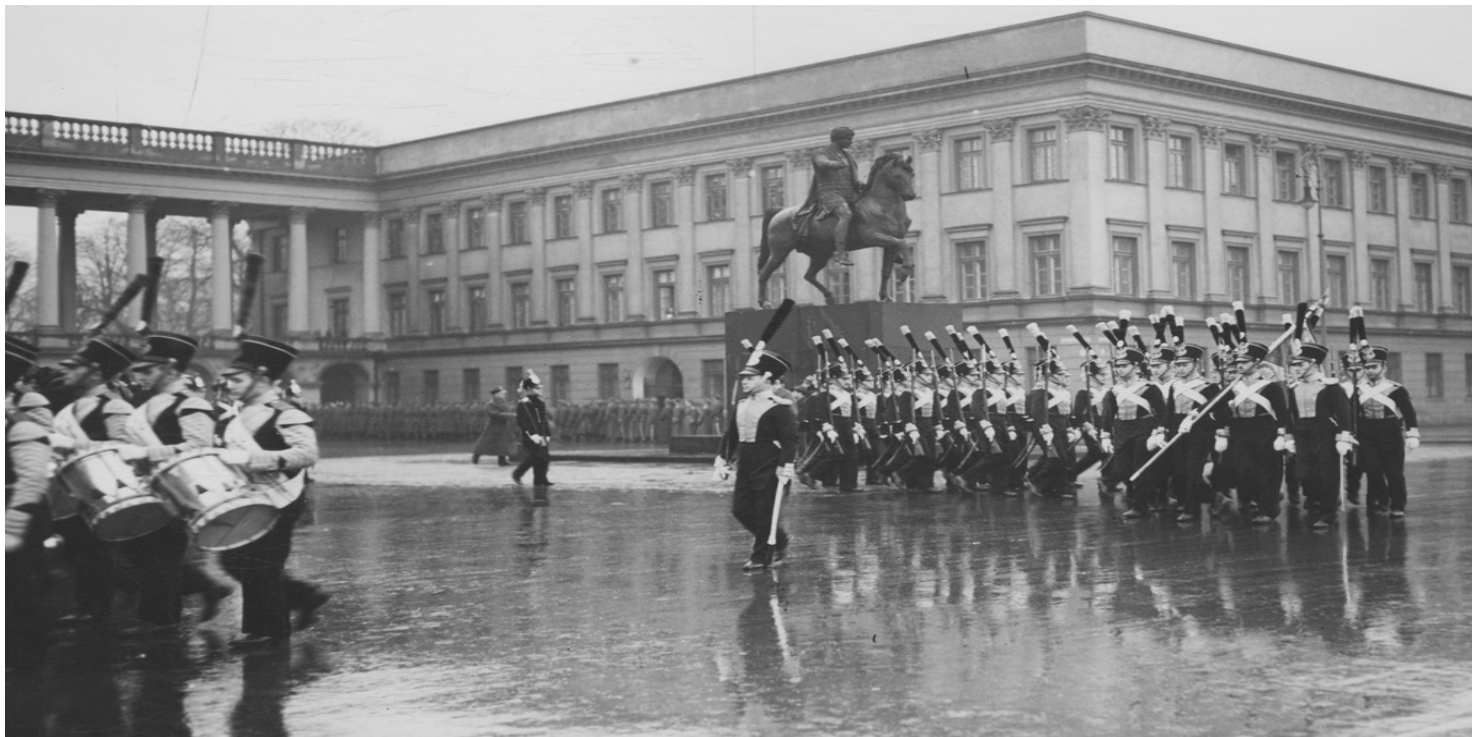
Obchody rocznicy powstania listopadowego w Warszawie, 29 listopada 1935 r.

https://przystanekhistoria.pl/pa2/tematy/niepodleglosc/87736,Na-Belweder.html