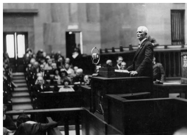
Obrady sejmu, 1928 r.

Marginalne znaczenie polityczne mieli konserwatyści, mimo że dysponowali znacznymi środkami finansowymi i silnym zapleczem intelektualnym oraz opiniotwórczą prasą, co czasami pozwalało im wpływać na bieżące życie polityczne.